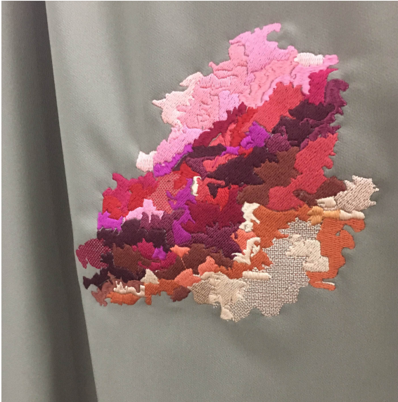
Detalle de instalación del trabajo de Fiorella Gonzales.