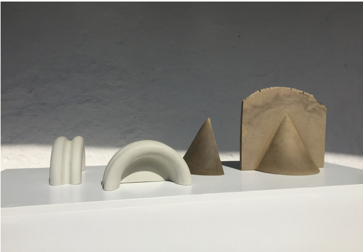
Algunos componentes de la obra de Natalie Herrera.

Para preguntas de prensa ESPIGA, Campos de Gutiérrez: Andrés Monzón (+57) 310 443 0408 / info@camposdegutierrez.org